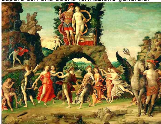
(Pala di San Zeno di Andrea Mantegna)

L'ispirazione al grande artista lombardo vissuto all'epoca delle corti rinascimentali ricorda i traguardi ambiziosi a cui conducono l'amore per il territorio e la passione per il proprio lavoro, esprimendo la scelta dell'Istituto di combinare la cura degli aspetti professionali ed operativi del sapere con una buona formazione generale.