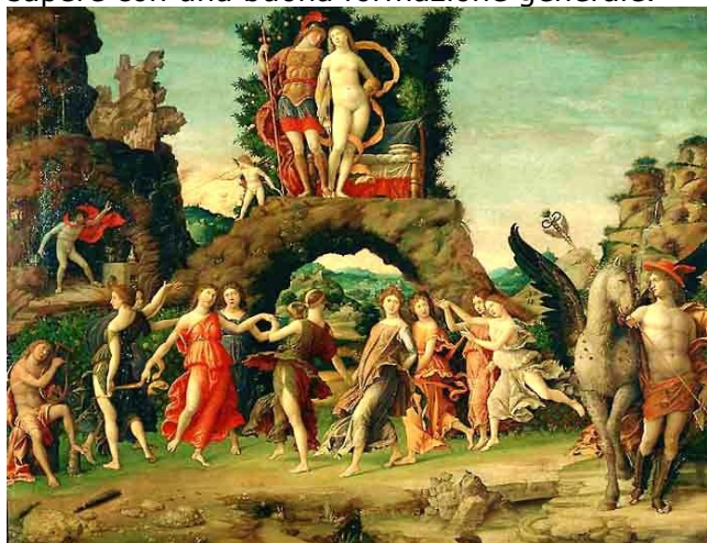
(Pala di San Zeno di Andrea Mantegna)

L'ispirazione al grande artista lombardo vissuto all'epoca delle corti rinascimentali ricorda i traguardi ambiziosi a cui conducono l'amore per il territorio e la passione per il proprio lavoro, esprimendo la scelta dell'Istituto di combinare la cura degli aspetti professionali ed operativi del sapere con una buona formazione generale.